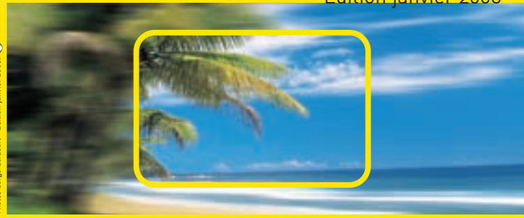
Edition janvier 2008